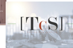
TcS #30: Presente y futuro de la taxonomía verde europea